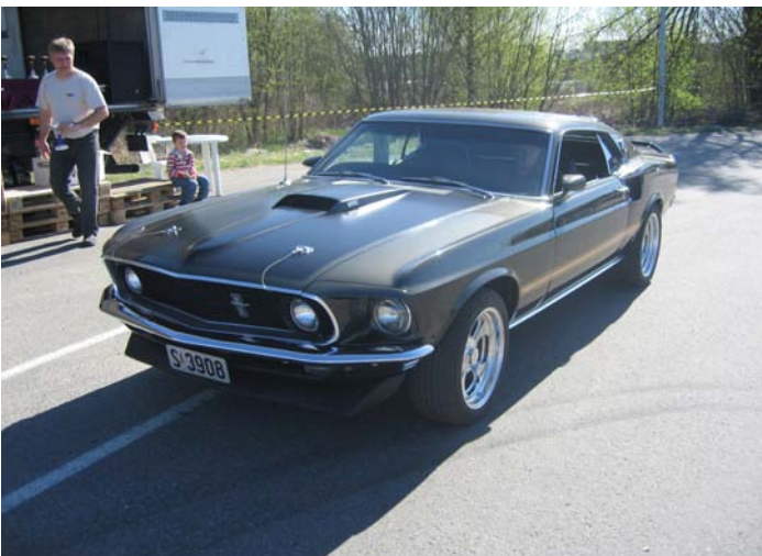
1969 Ford Mustang—Vidar Gudim