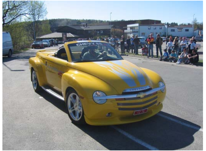
2004 Chevrolet SSR –Ernst Dalen