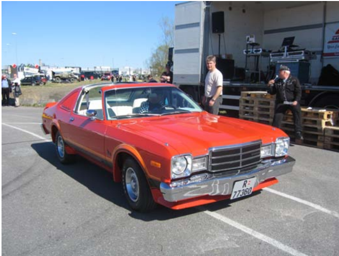
1977 Plymouth Volare - Tommy Kjensmo