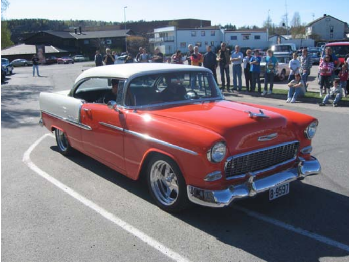
1955 Chevrolet Bel-Air + People Choice- Bjørn Larsen