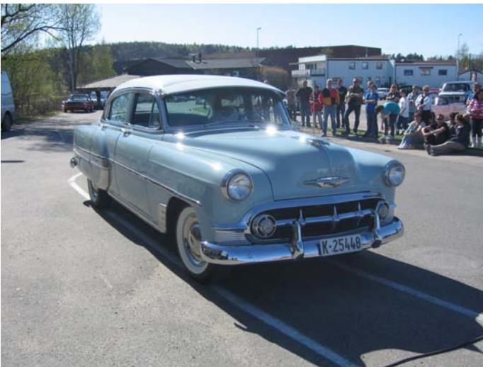
1953 Chevrolet Bel Air -Dag Sandnes