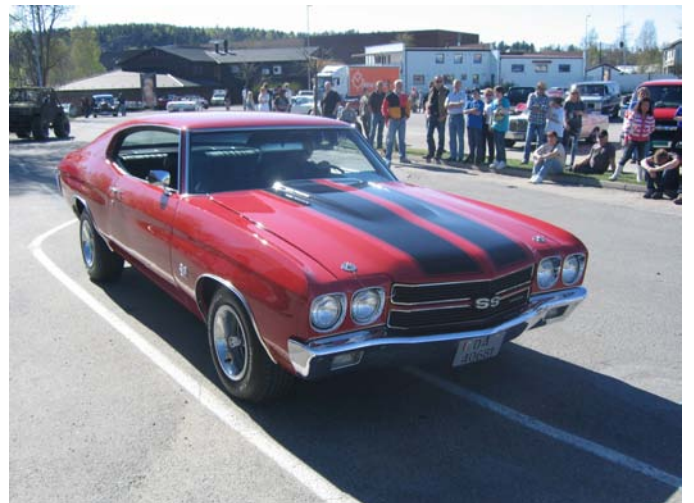
1970 Chevrolet Chevelle—Svein Mørk