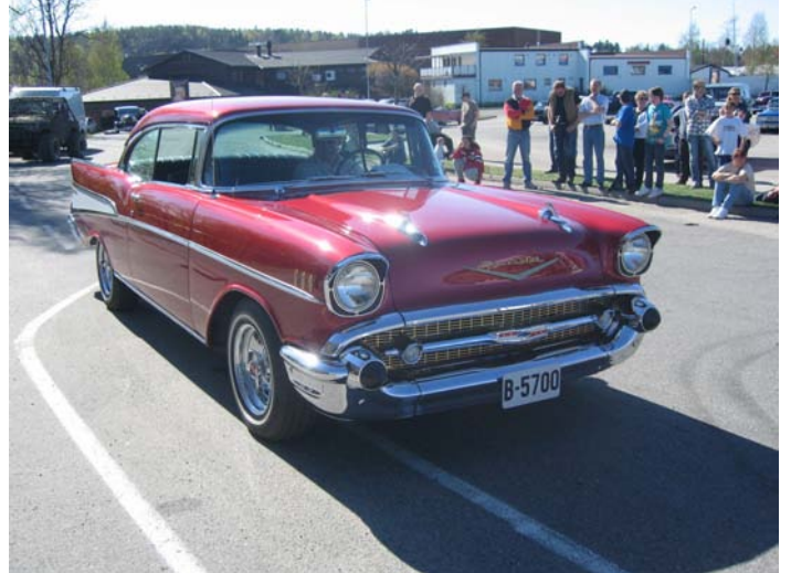
1957 Chevrolet Bel-Air—Odd Ivar Jørgen-