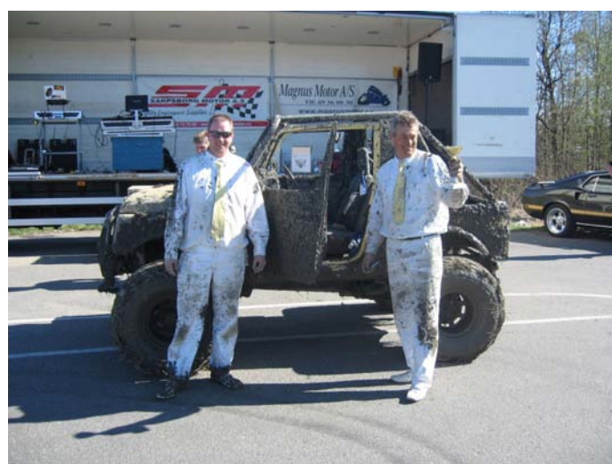
Off road gutta