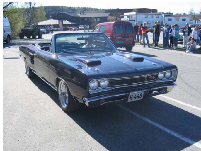
1969 Dodge Coronet R/T conv - Flemming Hein