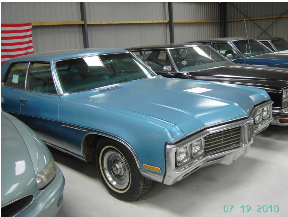
Denne står på Reersø Amerikanerbil museum i Danmark. 1970 Buick Electra 4d. sedan.