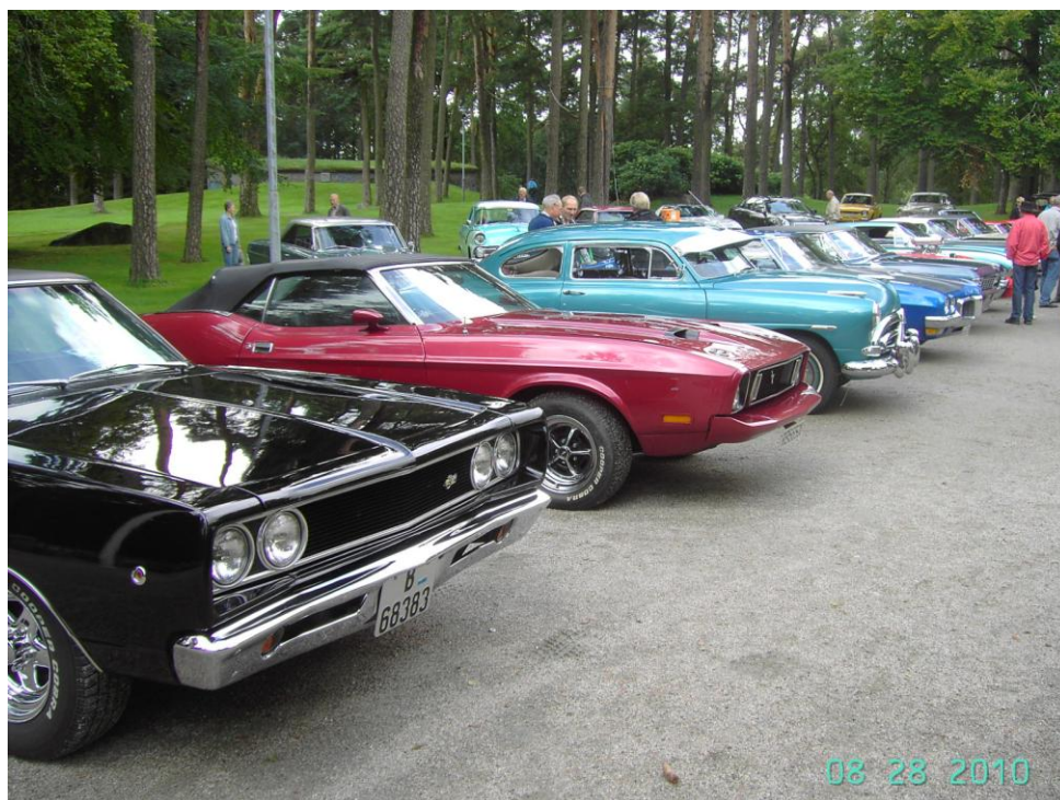
En god del medlemsbiler i Kulås under Bilens Dag ☺

Vi avslutter i tradisjon tro med gratis kake, kaffe og julegløgg til alle fremmøte.