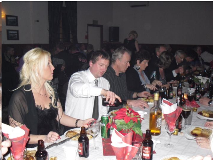
Som dere ser så kosær vi oss skikkelig.