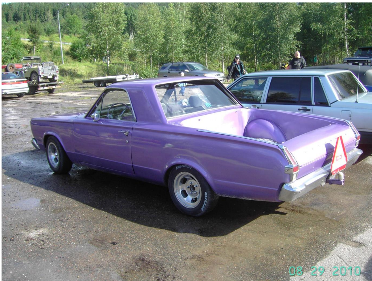
Only in Sweden: Plymouth Barracuda ombygd til pick up og registrert som A-traktor.....