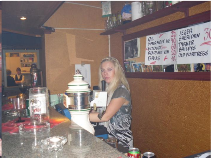
Og så har vi de som jobba.