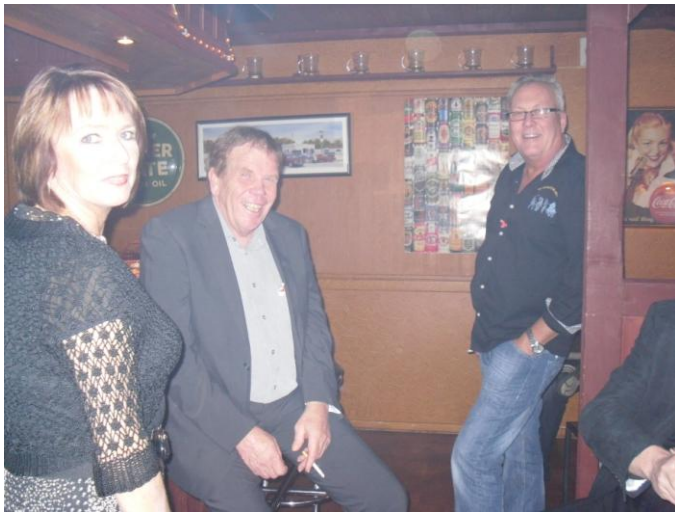
I baren var det aldri tomt.