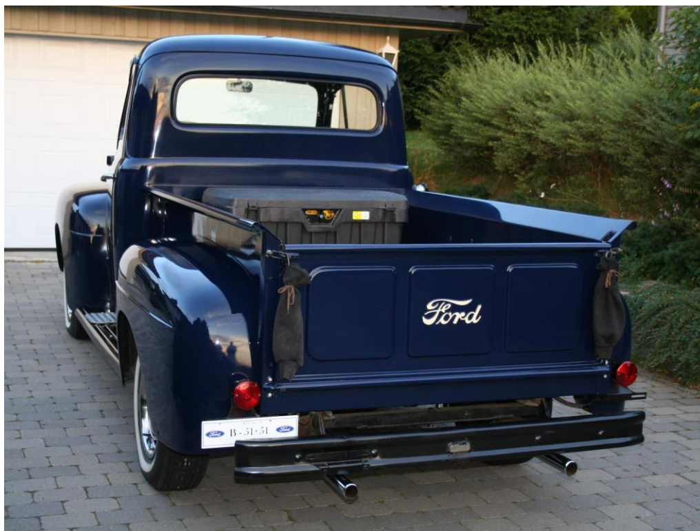
1951 FORD F-100