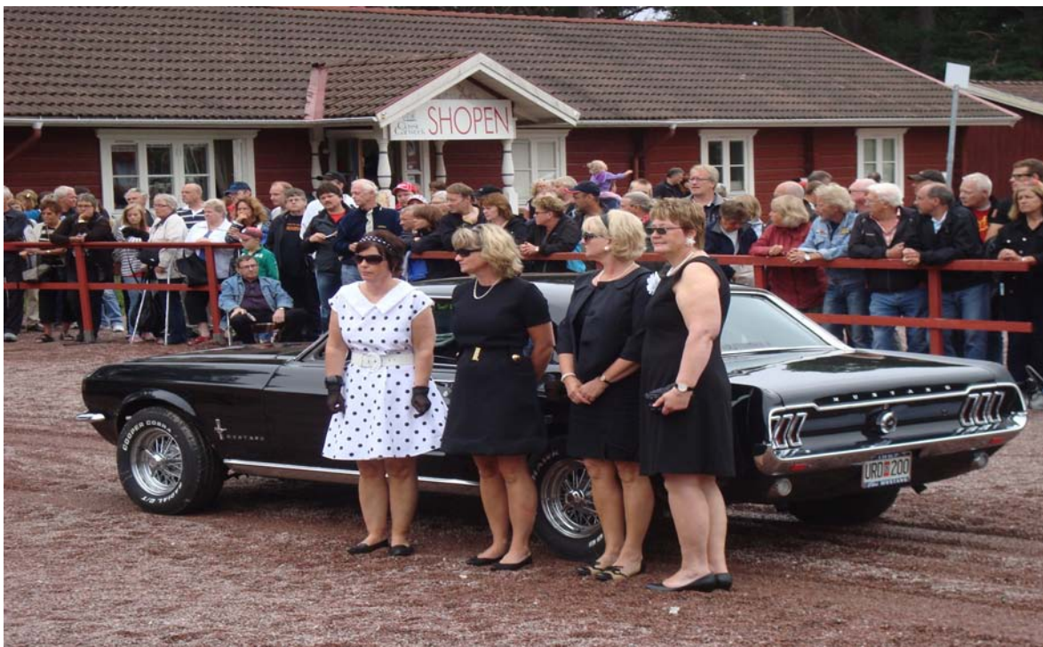
Før starten på ”Classic Lady”

bil og antrekk skal være fra samme tiår), og selvfølgelig cruising. Lørdag er finalen på Classic Car Week med bedømming av biler og stor markedsdag på Rättviks Travbana. Se www.classiccarweek.com for fullstendig