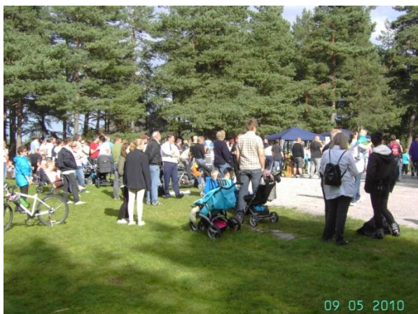
Mye folk i Tjernsparken