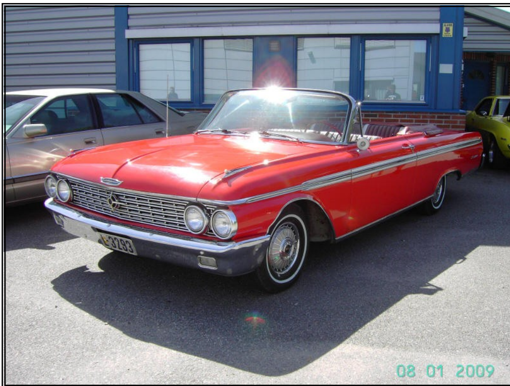
1962 Ford Galaxie Convertible Eier, Vidar Elvestad

Klubbens Adresse. Edvard Strandsvei 46, 1734 Hafslundsøy www.detroitcars.net