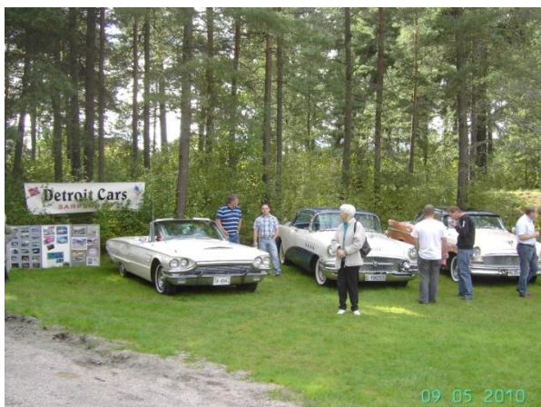
Og som "Øya folk" må vi jo være tilstede.