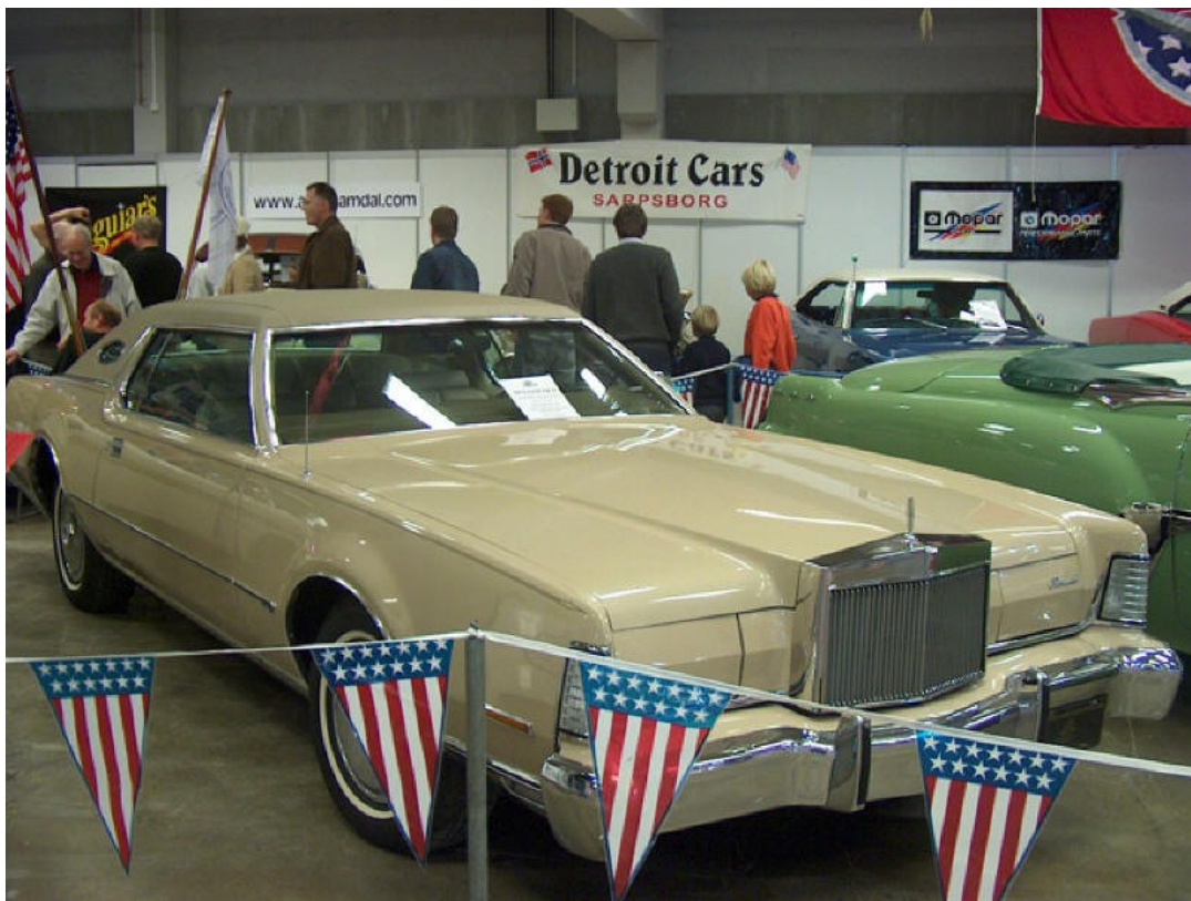
1973 Lincoln Continental Mk IV Eier, Vidar Aaserud

Klubbens Adresse. Edvard Strandsvei 46, 1734 Hafslundsøy www.detroitcars.net