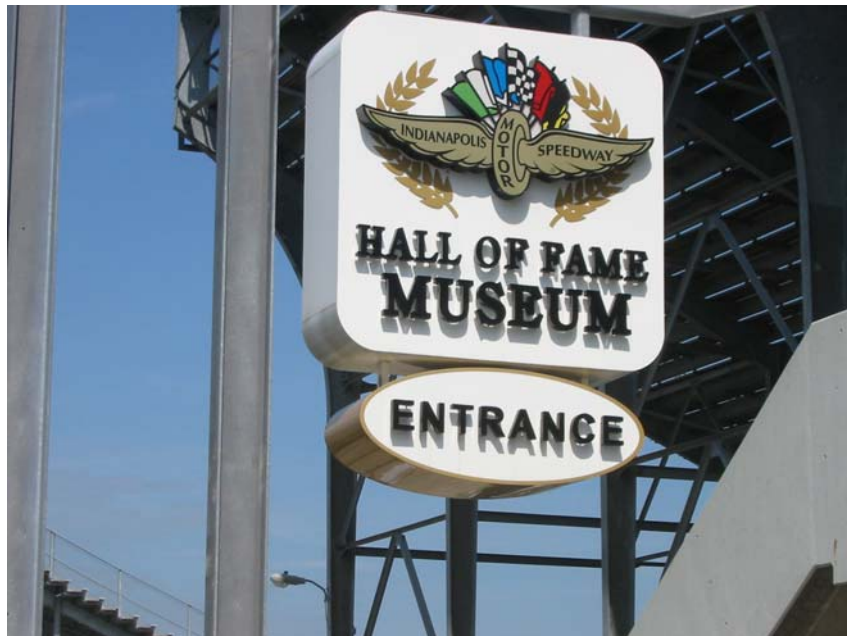
Indianapolis Motor Speedway "The racing capitol of the world".