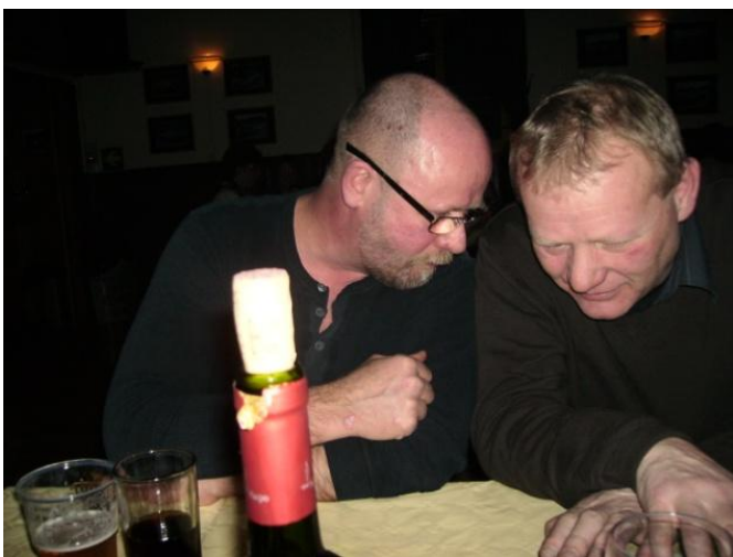
Det skravles, synges og danses.