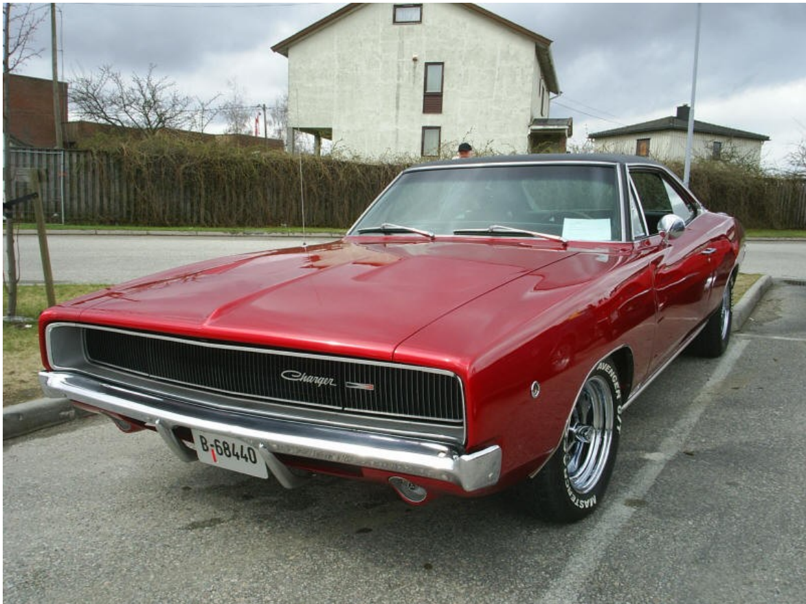
1968 Dodge Charger. Eier, Vidar Jansen

Klubbens Adresse. Edvard Strandsvei 46, 1734 Hafslundsøy www.detroitcars.net