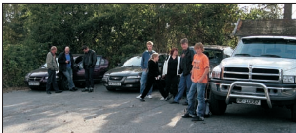
Hvor er bussen?