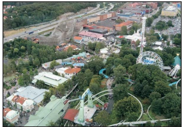
Jeg var så "tøff" at jeg dristet meg opp i Lisebergstårnet, mens ungene kjedet seg i hjel