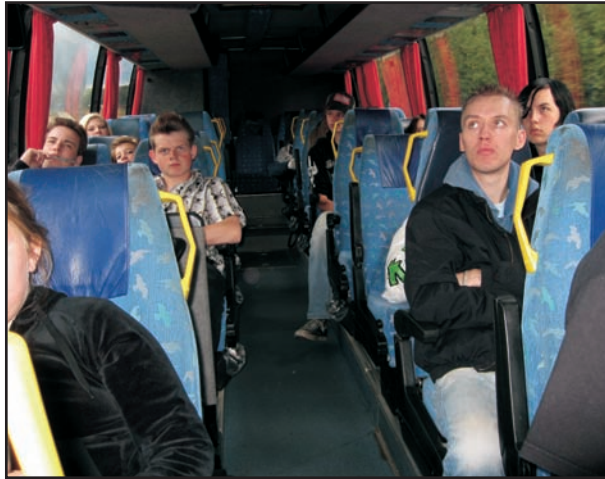
De unge håpfulle bak i bussen