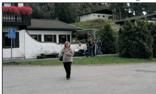
Kort pause på Håby