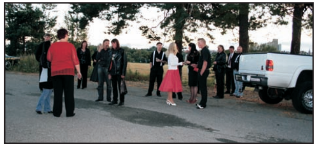
Liten samling på utsiden før middagen