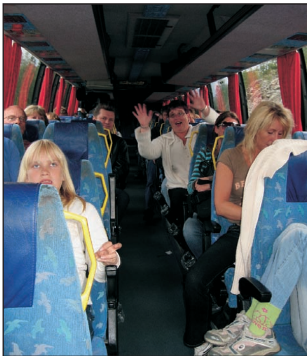
Foran satt de det ikke er noe særlig håp for