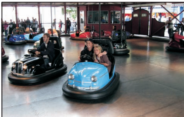
Hva er mer naturlig å starte besøket med når en er juniormedlem i Detroit Cars?