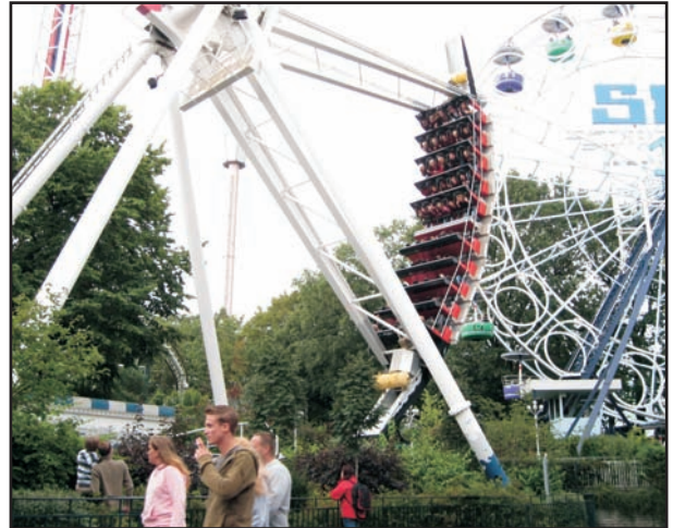
Hvordan bli syk i en fart