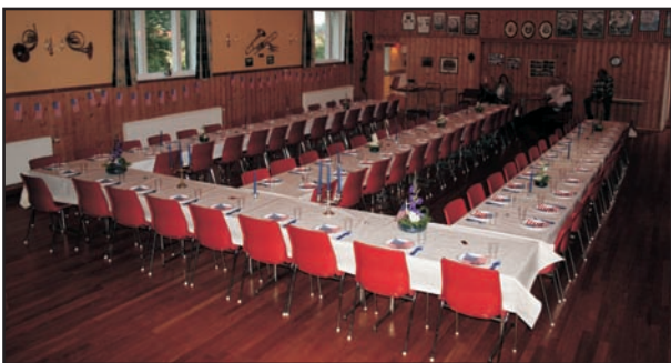
Stille før stormen