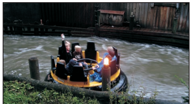
Om en ikke var bløt nok av regnet så kunne en ta denne flåten