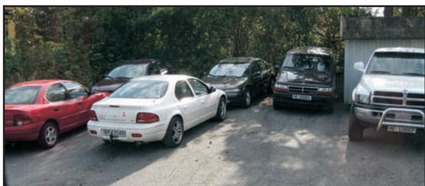
Hmm.. Noen som tyr til MoPar for daglig transport kanskje?

Vi var sånn ca. 34 stykker som klarte å rote oss om bord, etter en tre fire opptellinger så var det vel det vi kom fram til, uansett så var det ingen som ble meldt savnet på søndag selv om vi ikke alltid kom fram til samme antall når vi tellet passasjerene. Vi skulle jo ha en juniortur, men i bussen lignet det mer på en seniortur. Spesielt når en stod foran, for der hadde gamlingene satt seg. En kan jo ikke slippe løs den håpefulle for seg selv på et slikt farlig sted som Liseberg, eller er det noen av de eldre som også setter pris på en liten tur inn på stedet der de fleste blir som barn?