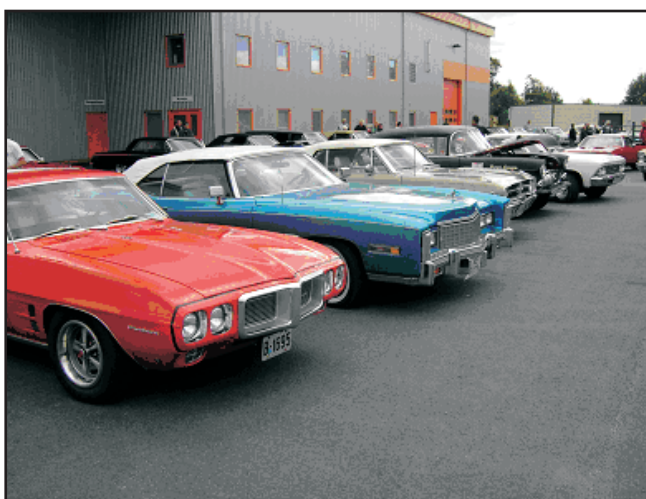
Mange biler hos Aarnes på årets Cruise In