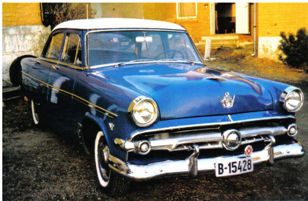
EIER VIDAR ELVESTAD

For mer utfyllende terminliste se vår webside: www.detroitcars.net